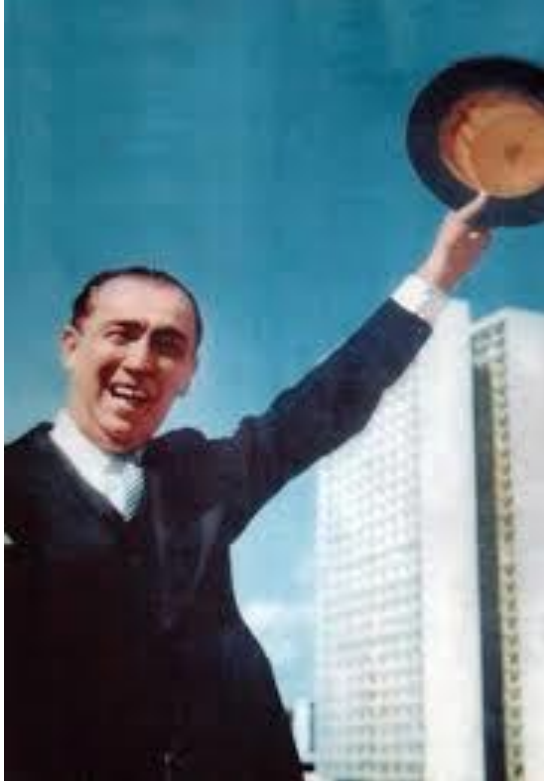
Juscelino Kubitschek (1956-1960) *1965*