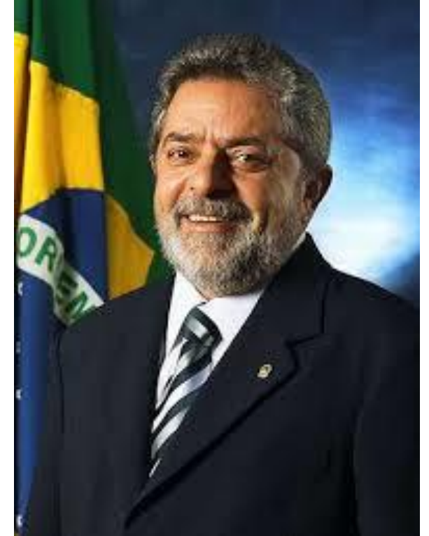
Lula (2003-2010) *2018-2021*