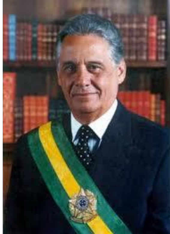
Fernando Henrique (1995-2002)